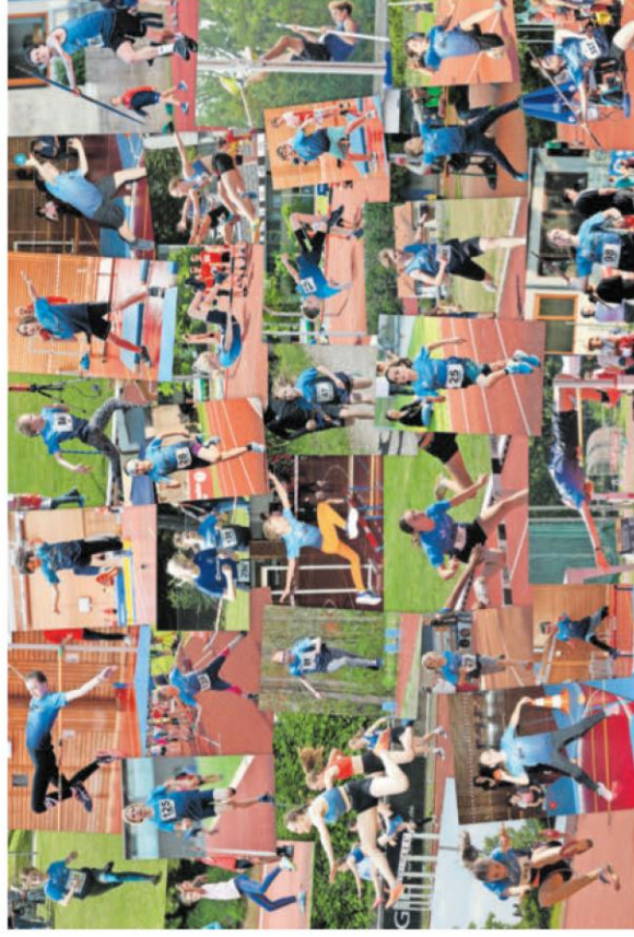
Collage: Bernd Buchwald

Beim deutschen Sportabzeichen ist wieder ein Aufschwung zu ver-